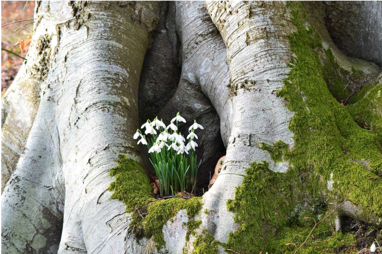
Schneeglöckchen auf dem Anwesen von Brechin Castle in Schottland

Hier ein paar Kulturtipps für Schneeglöckchen (bot. „Galanthus“):